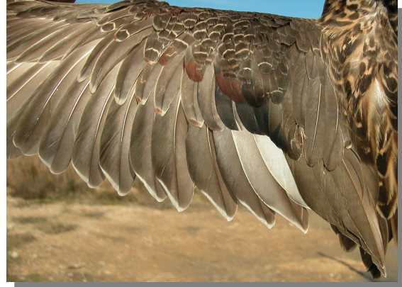
Ánade friso. Adulto. Hembra: diseño de secundarias (02-II).