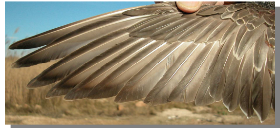
Ánade friso. Adulto. Hembra: diseño de primarias (02-II).