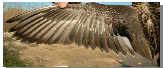
Ánade friso. Adulto. Hembra: diseño del ala (02-II).