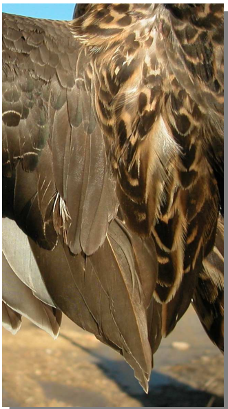
Ánade friso. Adulto. Hembra: diseño de terciarias (02-II).